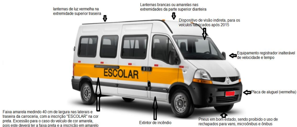
Figura – Requisitos de segurança analisados.

Importante destacar que a conferência das exigências mecânicas e técnicas relativas ao veículo são feitas pelas Instituições Tecnológicas Licenciadas – ITL, credenciadas junto ao DENATRAN. Desta forma, havendo aprovação em Inspeção de Segurança Veicular, presume-se que o veículo está totalmente adaptado à legislação federal, faltando somente a averiguação documental do veículo para a emissão do Termo de Autorização pelas Agências do DETRAN|ES.